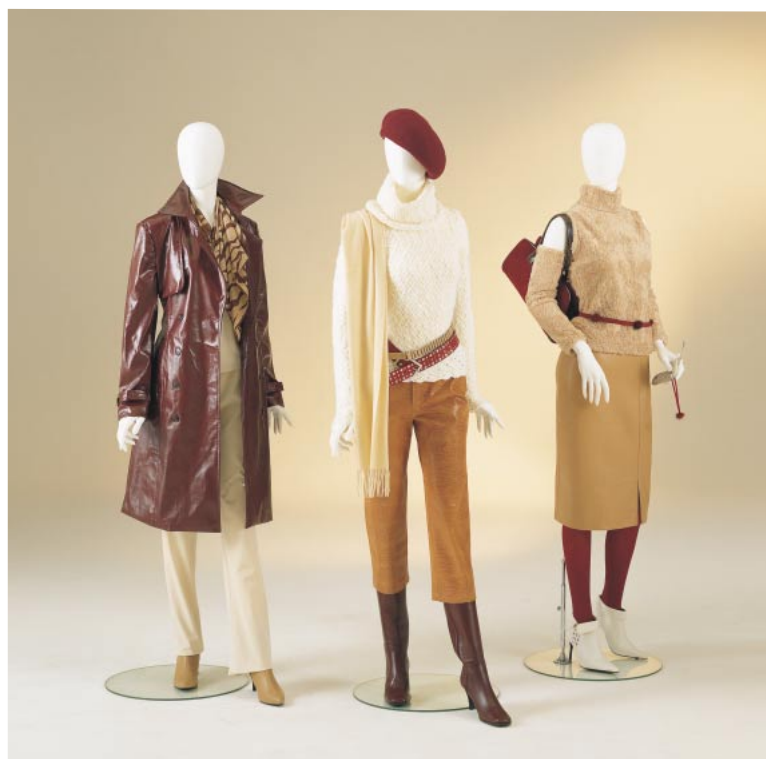
左より TFS-0121 TFS-0121 TFS-0120